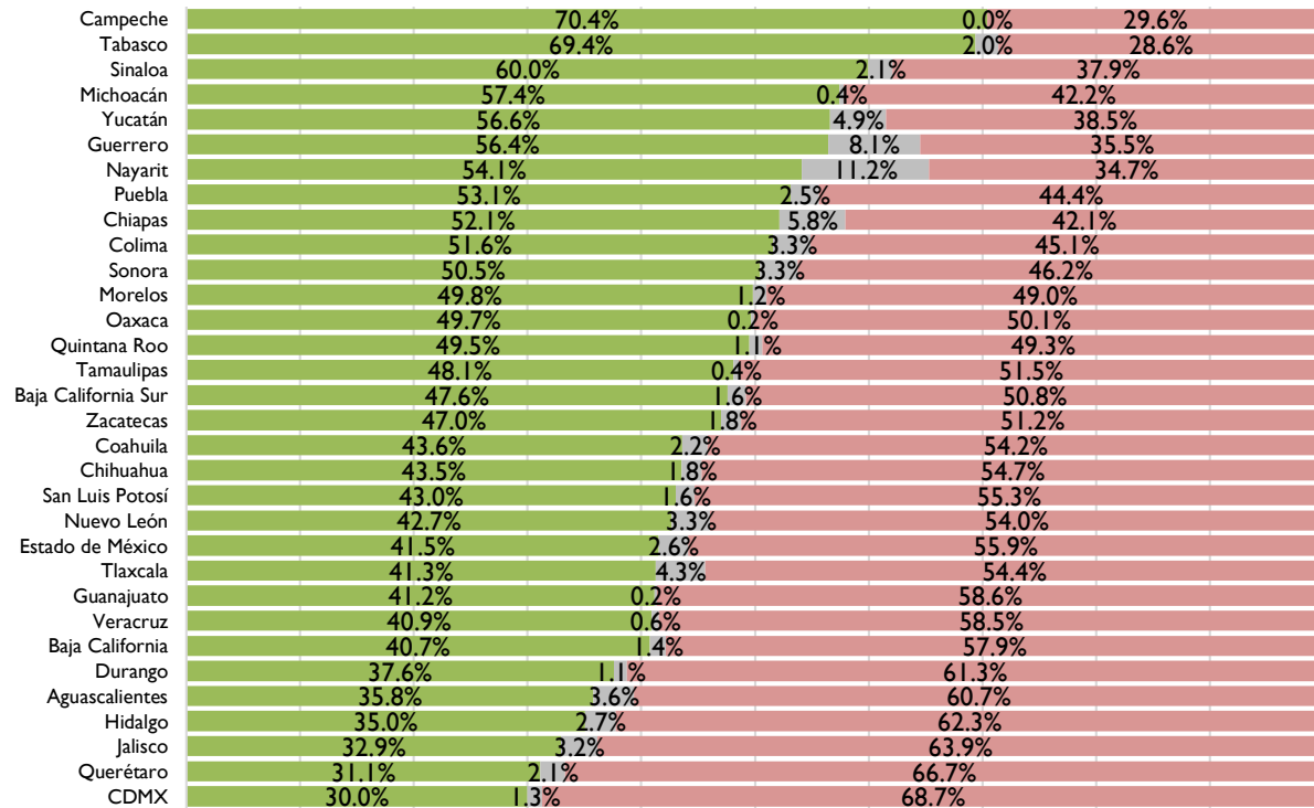
Histórico aprobación Presidente Andrés Manuel López Obrador

■ 44.0% APRUEBA ■ 2.3% INDIFERENTE ■ 53.7% DESAPRUEBA